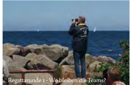
Regattarunde 1 - Wo bleiben die Teams?

Der Samstag begann bei strahlendem Sonnenschein. Start der 24. Schwanenstein-Regatta bei Windstärke 4. Endlich wieder Regattafeeling in Lohme. Sieben Crews nahmen den Dreieckskurs unter ihren Kiel. Dieser sollte 3 mal gesegelt werden. Doch die erste Runde dauerte schon länger als geplant. Das Orga Team war in Sorge das sich bei den Teams Langeweile breitmacht... falsch gedacht, auch nach der zweiten Runde nur strahlende Gesichter und der Wille nach der dritten Runde die Ziellinie zu überqueren.