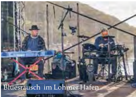
Bluesrausch im Lohmer Hafen