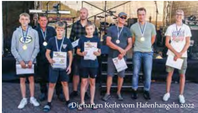
Die harten Kerle vom Hafenhangeln 2022

Große Unterhaltung am Nachmittag - 16 angemeldete Teams zum Schlauchbootrennen, da mussten die Organisatoren vom Tourismusverein Lohme gut koordiniert sein, um alle Zeiten zu erfassen und dann aus den besten 8 Teams, im Viertelfinale, Halbfinale und Finale den Sieger zu ermitteln. Das wurde nichts, denn im Finale lieferten sich das Team „NORDWIND“ und das Team „DAHEIM“ einen