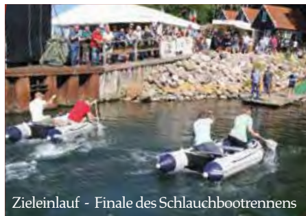
Zieleinlauf - Finale des Schlauchbootrennens