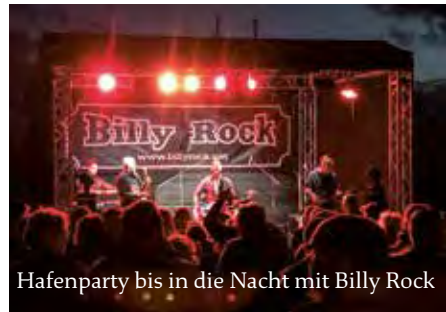
Hafenparty bis in die Nacht mit Billy Rock