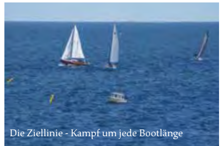
Die Ziellinie - Kampf um jede Bootlänge

Der Samstag begann bei strahlendem Sonnenschein. Start der 24. Schwanenstein-Regatta bei Windstärke 4. Endlich wieder Regattafeeling in Lohme. Sieben Crews nahmen den Dreieckskurs unter ihren Kiel. Dieser sollte 3 mal gesegelt werden. Doch die erste Runde dauerte schon länger als geplant. Das Orga Team war in Sorge das sich bei den Teams Langeweile breitmacht... falsch gedacht, auch nach der zweiten Runde nur strahlende Gesichter und der Wille nach der dritten Runde die Ziellinie zu überqueren.